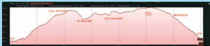
VOLTA CURTA 17 KM: Oix - Costeja - Coll de Pera - Salomo - Coll de Bucs - Coll de Samargol - El Paire - Oix